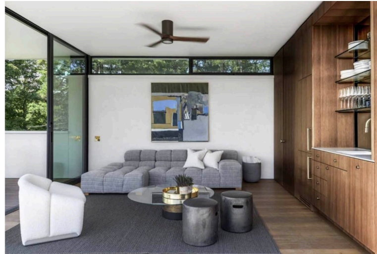
Zona relax con divano Tufty-Time disegnato da Patricia Urquiola per B&B Italia e pouf in ceramica della Restoration Hardware. Poltrona vintage anni 70 in tessuto bianco F598 di Pierre Paulin, quadro sopra la parete di artista anonimo acquistato alla Rhinebeck Antiques Show e coffee table Haumes Table disegnato da Massimo Casagna per Gallotti&Radice. Particolare della zona bar realizzata in legno Red Balau.