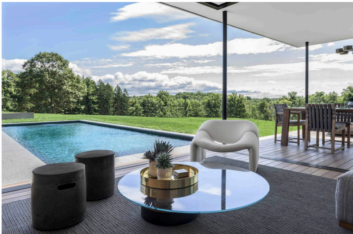
Zona living. In primo piano poltrona vintage anni 70 in tessuto bianco F598 di Pierre Paulin e coffee table Haumea Table disegnato da Massimo Castagna per Gallotti&Radice.

Al suo interno uno spazio compatto e perfettamente programmato dotato di un sistema di ventilazione dell'aria, una zona living che all'occasione può anche trasformarsi come camera per ospiti, un bagno completo e una cucina/bar oltre a uno spazio ripostiglio e sala macchine per la piscina. Todd Raymond voleva che la Pool House potesse funzionare anche come spazio notturno per feste o cocktail, e così un sistema di luci led intorno al perimetro esterno e un altro intorno alla piccola zona della cucina/bar vestono l'insieme, nel crepuscolo e durante la sera, di un'atmosfera diversa e adatta all'intrattenimento. Per gli arredi l'interior designer ha saputo giocare bene negli abbinamenti usando una tavolozza di colori neutri e naturali, come il divano della B&B Italia disegnato da Patricia Urquiola che si sposa perfettamente con il cocktail table di Gallotti & Radice e la poltrona bianca icona degli anni Settanta disegnata da Pierre Paulin, ma anche tessuti e tappezzerie che si abbinano perfettamente con le superfici dure, i rivestimenti murali e il pavimento in legno, armonizzando il tutto con il vetro, il gesso e l'ottone.