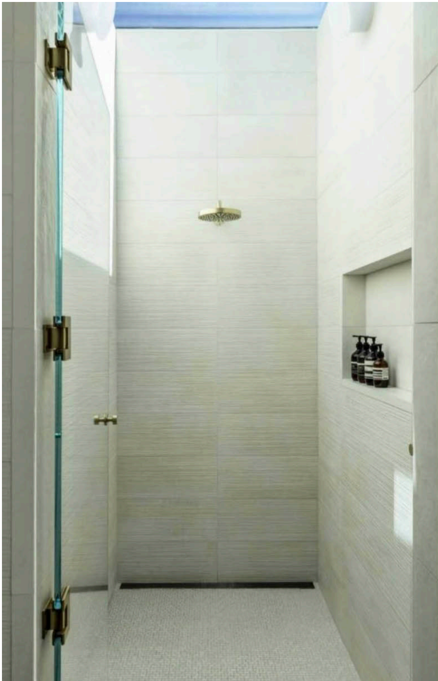
Interno della doccia realizzata in piastrelle modello Maku Light Rock dellaTown & Country Surfaces, rubinetterie della California Faucets con finitura in ottone anticato.